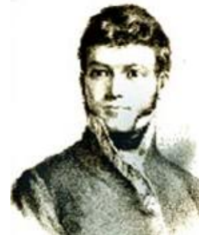
Francisco Javier Mina (1789-1817)

En 1817 cundió dentro de la Comandancia de Oriente la noticia del desembarco de don Francisco Javier Mina en territorios del Nuevo Santander. Sus andanzas y posterior fusilamiento sirvieron para alentar las ideas revolucionarias en las Provincias. Para entonces, la Caja Real de