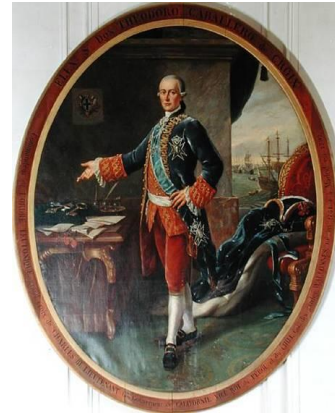
D. Teodoro de Croix (1716-88)

Los primeros atisbos de división entre criollos y “gachupines” (como fueron calificados los peninsulares que arribaron a la Nueva España en las postrimerías del virreinato) eran específicamente ostensibles en Saltillo hacia noviembre de 1777, fecha en que tuvo lugar la visita del primer comandante general de las Provincias Internas, don Teodoro de Croix. Por esas fechas, el capellán de su expedición, el misionero franciscano fray Agustín de Morfi, dio cuenta al Rey del distanciamiento que ocurría entre ambas facciones en los siguientes términos: