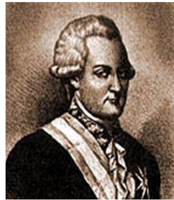
Segundo conde de Revillagigedo Virrey de 1789 a1794

De entre las poblaciones que conformaban las cuatro Provincias Internas de Oriente, la villa de Saltillo fue la primera en proclamar su independencia respecto de España. 12 El motivo principal fue la paulatina pérdida del control económico y político de las élites, y el circunstancial, como luego se verá, la insurrección de los granaderos locales contra la Comandancia. Hasta ese momento, el cabildo municipal había sido el principal instrumento para la defensa de los intereses locales. Sin embargo, alentados por el gobierno borbón, a partir de 1762 los peninsulares empezaron a comprar las regidurías vendibles de la corporación, en detrimento de los antiguos criollos quienes, de acuerdo con la política