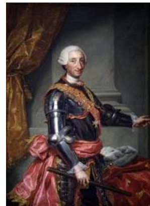
Carlos III de España (1716-1788)

La designación del exaltado nacionalista andaluz don José de Gálvez Gallardo como visitador general, en el año de 1765, marcó la pauta de su inicio. Las Reformas, en general, fueron un conjunto de medidas bastante complejo y a veces hasta confuso, tanto para los participantes del proceso como para los historiadores modernos, debido a su carencia de unidad y porque su funcionamiento podría dividirse al menos en tres etapas diferentes: la primera abarcó los reinados de Felipe V, Fernando VI y primera parte del de Carlos III, prolongándose hasta 1776 aproximadamente. Esa etapa se caracterizó por el secuestro de la administración de todas las rentas y bienes enajenados o arrendados, el establecimiento de los nuevos monopolios fiscales, la supresión parcial de la venta de empleos, el establecimiento de la tropa fija, las milicias y la expulsión de los jesuitas. 4