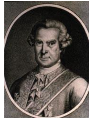
Don José de Gálvez, (1720-1787)

La segunda etapa se prolongó diez años: de 1776 a 1786. Se le conoce como fase del “reformismo radical” y coincide con la época en que don José de Gálvez se desempeñó en el Ministerio de Indias. Durante ese tiempo se restaron facultades a los virreyes, se estableció la Comandancia de las Provincias Internas, se decretó la libertad de comercio y se suprimieron las Alcaldías Mayores y Corregimientos, en cuyo lugar se establecieron las Intendencias y subdelegaciones. Los nuevos cargos fueron desempeñados por funcionarios designados por el virrey. Con esas medidas se implantó en la Nueva España el sistema burocrático, suprimiéndose —aunque nunca totalmente— la venta de los puestos públicos. Otras disposiciones semejantes de la época fueron: la supresión de la antigua práctica de repartimiento —con el consiguiente descontento de los comerciantes criollos que previamente se beneficiaban de ella—, el fomento de las obras públicas, las medidas para apoyar y robustecer las finanzas municipales, el inicio de la política en favor de los estratos desprotegidos y la lucha contra los privilegios eclesiásticos y gremiales.