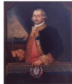
Don Bernardo de Gálvez (1746-1786)

La tercera etapa se inició en 1787, tras la muerte del visitador Gálvez. Durante ese tiempo gobernaron en la Nueva España una serie de funcionarios ilustrados como don Bernardo de Gálvez —pariente del visitador— y don Juan Francisco de Güémez Pacheco y Padilla, segundo conde de Revillagigedo. Si bien casi todos los virreyes estuvieron en contra de las medidas descentralizantes, que obviamente les restaban poder, la mayoría parece haber estado consciente de la necesidad de implementar reformas en el gobierno colonial. No obstante, la situación cambió en la década de los noventa, cuando los “ilustrados” ministros españoles, alarmados por los conflictos revolucionarios