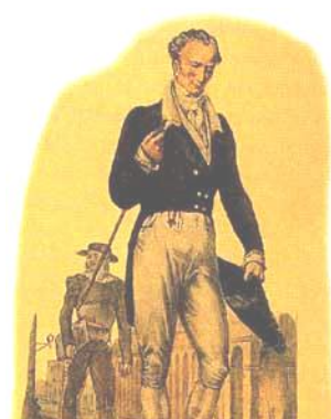
Traje de Regidor en México Siglo XVIII

A excepción de los puestos de gobernador y comandante, casi todos los demás cargos seguían siendo comprables por lo que, de acuerdo con la política de exclusión del criollismo practicada por los borbones, pudieron ser adquiridos en su totalidad por inmigrantes nacidos en la Península, quienes en adelante combinaron sus nuevas ocupaciones con las actividades que previamente desempeñaban. 18