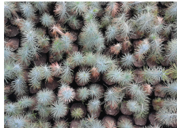
Pinos para reforestación

De igual modo, la Secretaría de Agricultura y Ganadería, encargada de la celebración, así como todas las dependencias gubernamentales, tendrían que colaborar activamente en el desarrollo de las fiestas y en la creación de una conciencia cívica forestal.